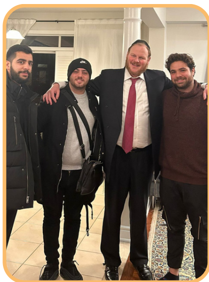
שבת מרוממת בבית של הרב עם עדן, חיים ואוראל! תודה רבה שהגעתם!

5. תורה וגמילות חסדים - הרב מבריסק סיפר שנפגש עם ה'חפץ חיים' שאמר לו כך: "אנשים באים אלי כדי לבקש עצות להינצל מצרות שונות. והנה נאמר בגמרא: 'שאלו תלמידיו של רבי אליעזר הגדול את רבם מה יעשה אדם וינצל מחבלי משיח? ענה להם: יעסוק בתורה ובגמילות חסדים'. אמר ה'חפץ חיים': 'אם יאספו את כל האחרונים, ואפילו את כל הראשונים, וכל הגאונים, האמוראים והתנאים, האם יוכלו לתת עצה טובה יותר מרבי אליעזר הגדול? ומה רוצים ממני, ישראל מאיר, שאתן להם עצה?!"